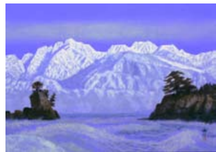
大島秀信「洪谿の磯」

現在、学校法人職藝学院顧問・特別講師、県芸術文化協会参議、富山県立近代美術館・富山県立水墨美術館・砺波市美術館各館の収蔵美術品選定委員等。日本文芸家協会・日本ペンクラブ・現代歌人協会会員、日本短歌協会理事、日本近代文学館評議員・日本現代詩歌文学館振興会評議員等。