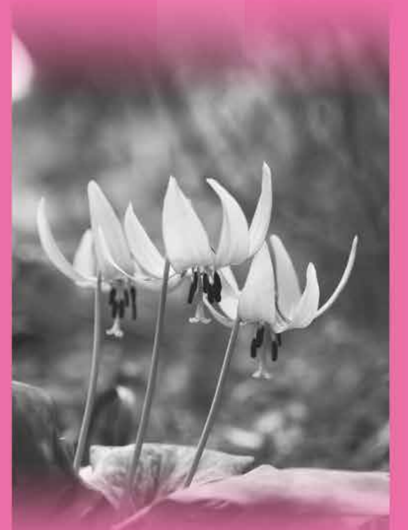
大伴家持の歌に詠まれた「堅香子」の花